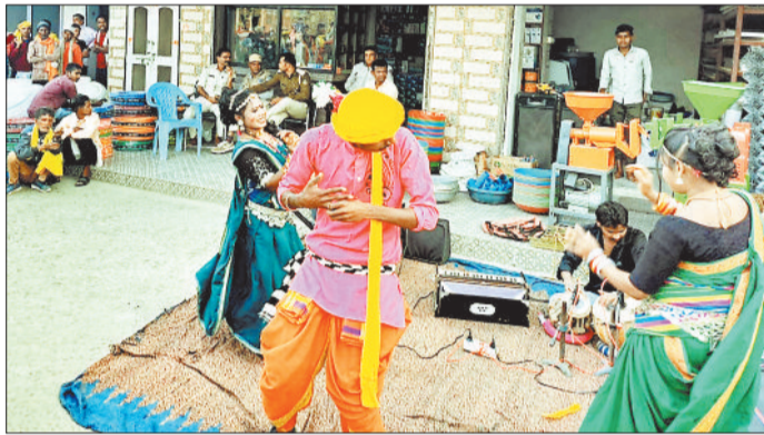
नुककड़ नाटक करते हुए कलाकार।

गर्मी के सीजन में जंगल में पीले सोने की जमकर बारिश होती है और पीले सोने से ही ग्रामीण मालामाल होते हैं लेकिन पहले सोने के चक्कर में लोग जंगल को आग के हवाले कर देते हैं जिससे जंगल के साथ-साथ वन्य प्राणियों को भारी नुकसान उठाना पड़ता है। जंगल में आग लगने की घटना से लगातार जंगल खराब हो रहे हैं और औषधी भी नष्ट हो रहे हैं। इसी तरह की घटनाओं को रोकने के लिए कटघोरा वन मंडल अधिकारी ने एक नई पहल की है। इसके लिए वन विभाग द्वारा नुककड़ नाटक के माध्यम से लोगों को जंगल से मिलने वाले लाभ के बारे में बताया जा रहा है। जैसे जंगल को आग से बचना है इसकी जानकारी दी जा रही है। बाजारों में नुककड़ नाटक लग रही है जहां बड़ी संख्या में लोगों को पाठ पढ़ाया जा रहा है। उल्लेखनीय है कि जिले के कोरबा और कटघोरा वन मंडल में विभिन्न प्रकार के वन औषधीय की भरमार है। साथी ही विभिन्न प्रकार के वन्य प्राणियों का बसेरा