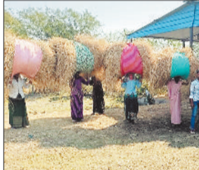
पैरा इकट्ठा करती समूह की महिलाएं।