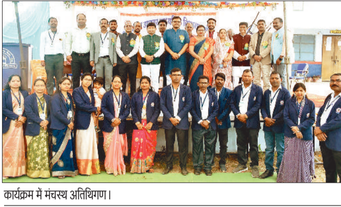
कार्यक्रम में मंचस्थ अतिथिगण।