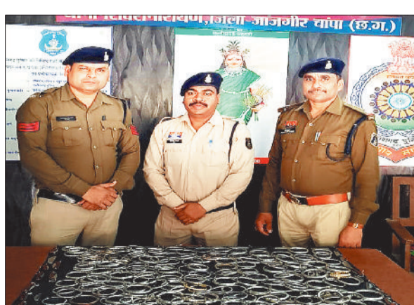
जब्त कड़े के साथ पुलिस अफसर।

ज्ञात हो कि शिवरीनारायण में आयोजित ऐतिहासिक मेले में प्रतिदिन हजारों श्रद्धालुओं एवं पर्यटकों के आगमन को दृष्टिगत रखते हुए जिला पुलिस प्रशासन द्वारा सुरक्षा एवं यातायात व्यवस्था के व्यापक इंतजाम किए गए हैं। इसी के तहत मेले में घूम रहे असामाजिक तत्वों से बड़ी मात्रा में कड़े को जब्त करने की कार्रवाई की