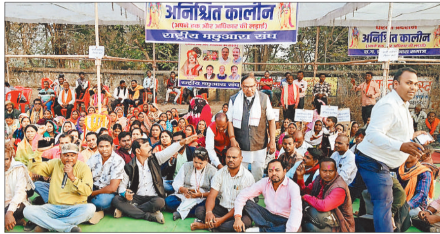
आंदोलन पर बैठे मछुआ समिति के पदाधिकारी।

राष्ट्रीय मछुआरा संघ ने जांजगीर चांपा जिले में शासकीय तालाबों में मछली पालन के लिए पट्टा जारी करने में गैर मछुआ सहकारी समितियों को आंख मूँकर पट्टा जारी करने का आरोप लगाया है। पिछले दिनों शिकायत पर सौंपा था। उनकी शिकायत पर उच्चाधिकारियों ने जांच के आदेश भी दिए थे, लेकिन संघ का कहना है कि विभाग द्वारा मनमाने तरीके से उक्त ग्रामों के तालाबों को गैर मछुआ सहकारी समितियों को