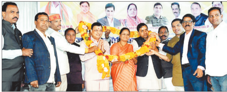
उद्योग मंत्री का स्वागत करते हुए समाज के पदाधिकारी।